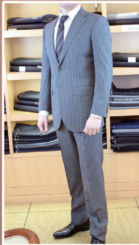
お仕立て上がりの一例

レディースもお取扱いしております。(パターンオーダー) パンツの他にも、スカートもご用意しています。